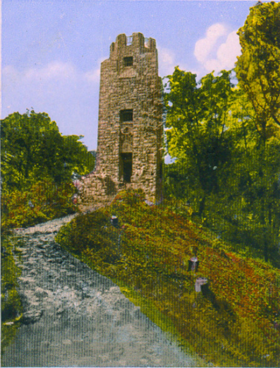
Aussichtsturm auf der hohen Acht