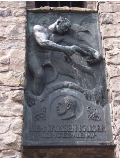
Bronzerelief über dem Turmeingang

Einige Zahlen zum Turm: der Turm ruht auf einem 2 Meter hohen Sockel von 7,50 mal 6,00 Meter Grundfläche. Das Grundmaß des Turms auf dem Sockel beträgt 5,50 mal 5,50 Meter, die Höhe mit Sockel beträgt 16 Meter. Er hat im Untergeschoß eine Mauerstärke von 1,25 Meter, die sich nach oben auf 1 Meter verjüngt. Schmuck des Turms ist eine einzige mächtige Bronzeplatte von 2,70 Meter Höhe, die über dem Eingang angebracht ist. Das Relief darauf zeigt eine heldenähnliche Gestalt im Kampf mit einer Schlange und darunter das Bildnis von Kaiser Wilhelm I. im Profil.