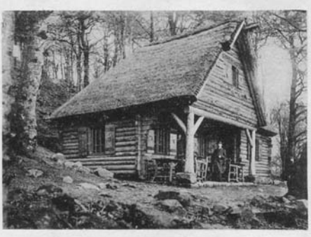
Blockhaus. (Erfrischungsstation) an der Hohen Acht

Wegen des Turmbaus war eine ältere Blockhütte auf dem Plateau abgebrochen worden. Stattdessen wurde nach dem Entwurf des Architekten Freiherr von Tettau für rund 4.000 Goldmark in halber Höhe der Kuppe, etwa 100 Schritte unterhalb des Turmes und in der Nähe des Aufgangs zum