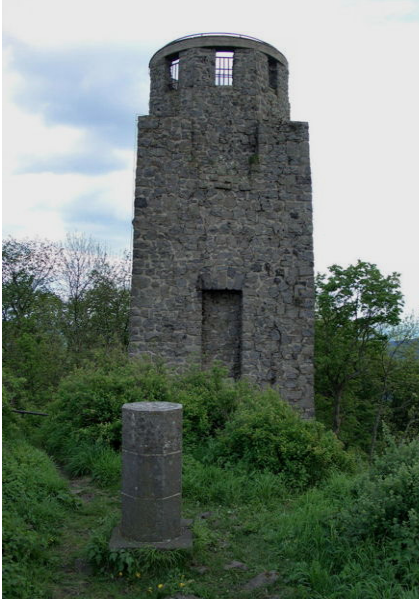
Der Kaiser-Wilhelm-Turm heute

Die Jubelrufe auf den Kaiser und König sind verstummt. Am Sonntag, 6. September 2009, wurde das runde Jubiläum des Denkmals natürlich Anlass für eine angemessene Feier.