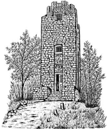
Zeichnung: Wolfgang Pantenburg

Was aber war der Grund, in der Eifel einen solchen Aussichtsturm zu errichten? Erbaut wurde er in einer Zeit, als Kaiserverehrung großgeschrieben wurde. Bereits 1903 befasste sich ein Ausschuss im Kreis Ade-