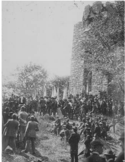
Einweihungsfeier am 23. Juni 1909

Abordnungen der Krieger- und Ortsvereine mit ihren Fahnen, die Schulen, Vertreter der Behörden und der Geistlichkeit waren