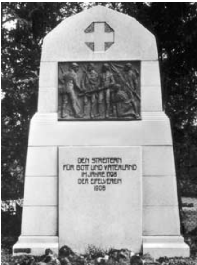
Eifelverein Arzfeld: Als Erinnerung an den Klöppelkrieg 1798 stellte der Eifelverein 1906 ein Mahnmal auf, welches auch heute gepflegt wird.