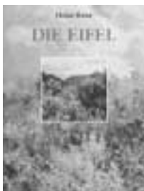
Geschichte der Eifel von Heinz Renn † 416 S., 25 x 17 cm Preis: 15,30 €