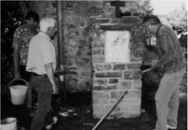
Eifelverein Ulmen: Die Kreuzwegstation wird neu verputzt.