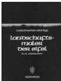
Landschaftsmaler der Eifel von Conrad-Peter Joist 320 S., 25 x 18 cm Preis: 20,40 €