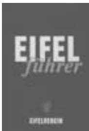
Eifelführer 2000 38. Auflage, Eifelverein 700 S., 17 x 11 cm Preis: 21,50 €