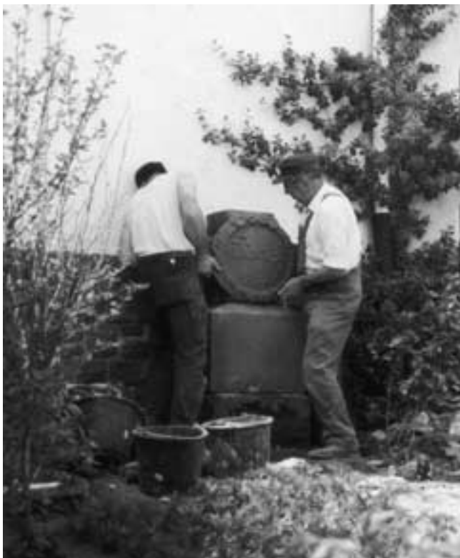
Eifelverein Bleialf: Gedenkkreuz an der Pfarrkirche St. Marien wird instandgesetzt