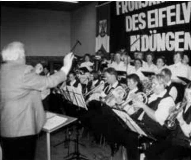
Eifelverein Düngenheim: Das Jugend-Bläsercorps in Aktion