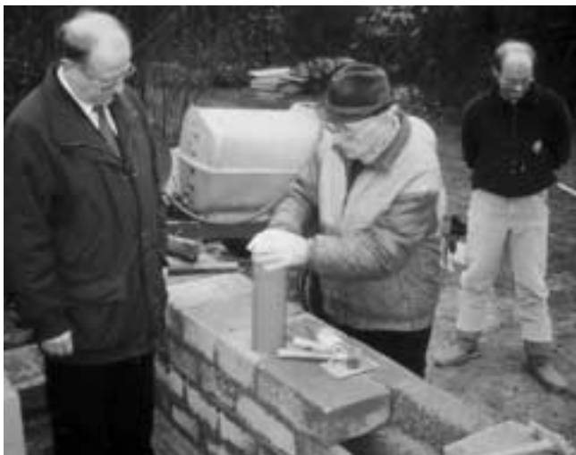
Eifelverein Kaisersesch: Während der Bauphase des Römerturms...

mälern oder zu technischen Anlagen wie Talsperren und Kraftwerken),